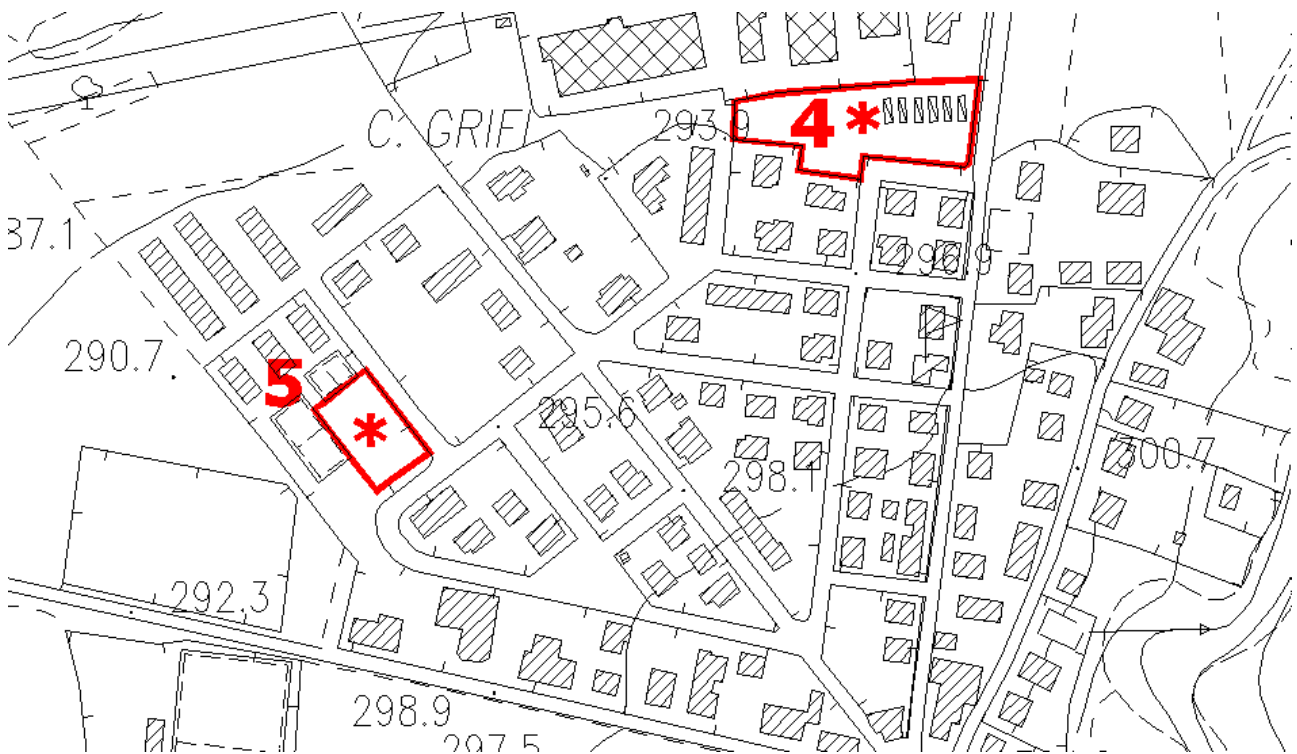
Fig. 1.2: Aree 4 e 5 adibite a manifestazione temporanea