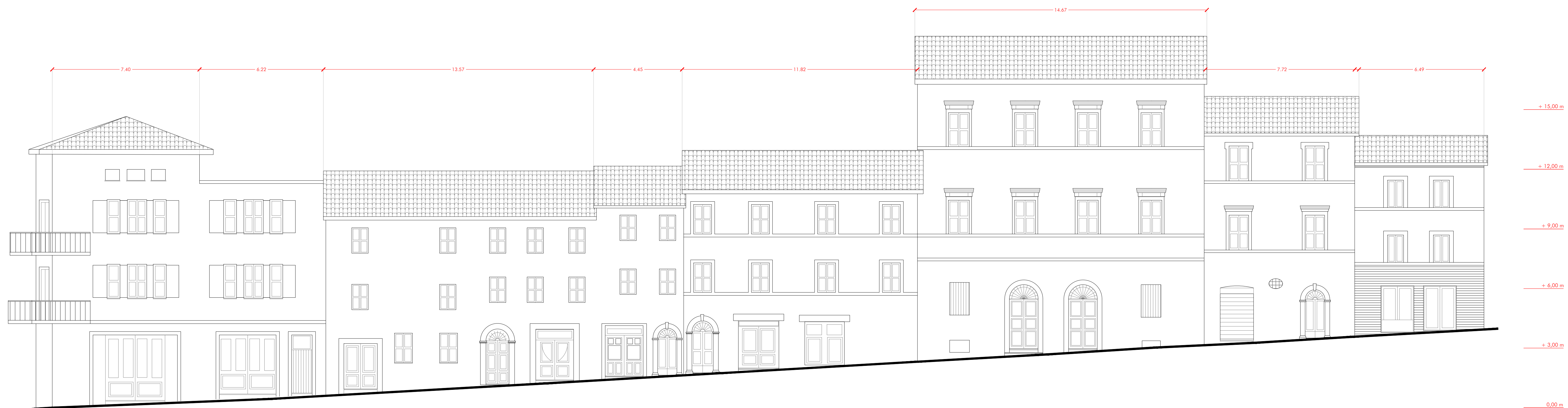
PROSPETTO 1b Via Roma