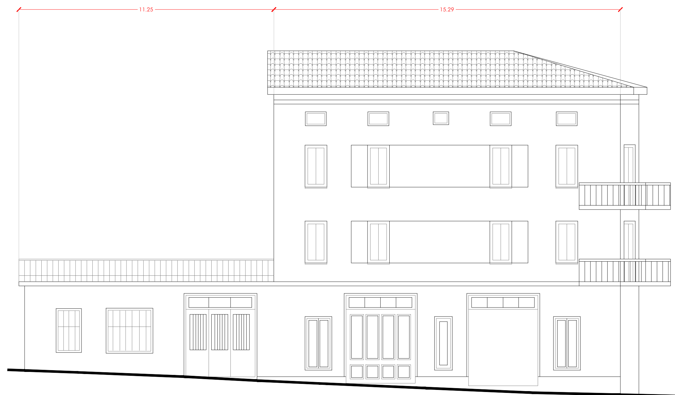
PROSPETTO 1a Via del Lago