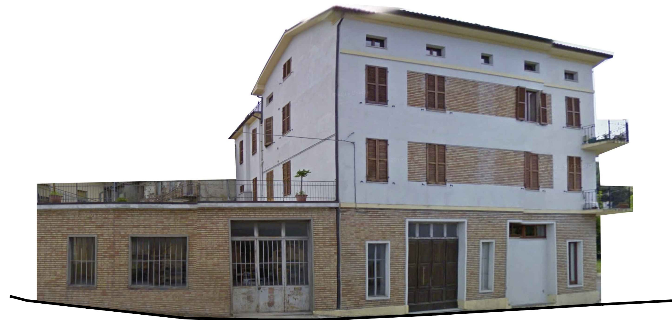
PROSPETTO 1a Via del Lago

LEGENDA Rilievo dei prospetti su spazio pubblico Art. 9 NTA del PUA