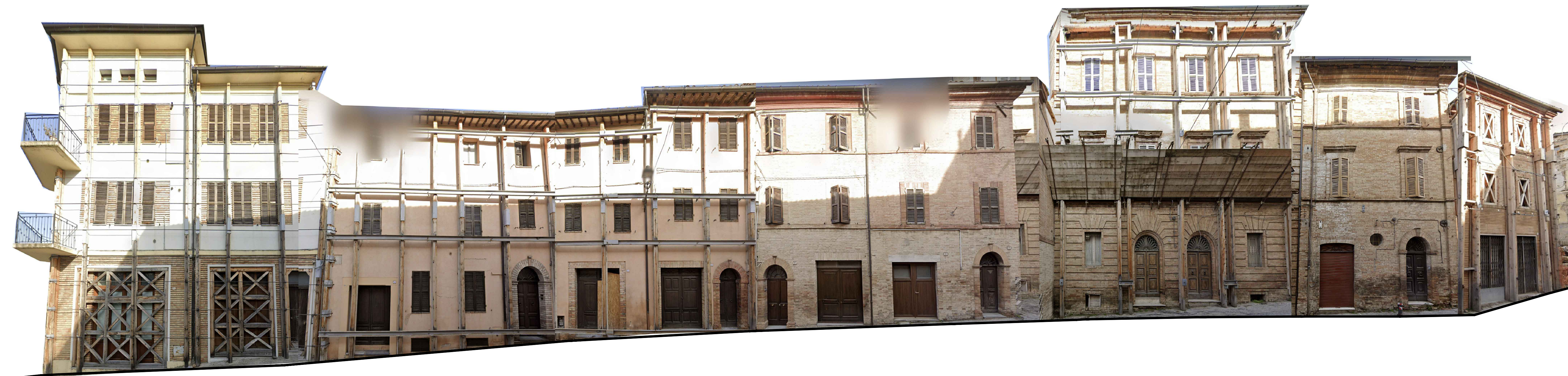
PROSPETTO 1b Via Roma